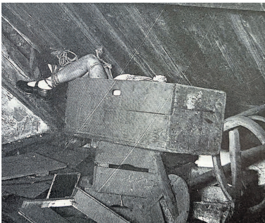
Een politiefoto van de zolder boven het bananenpakhuis.

“ DE WILDSTE GERUCHTEN DEDEN DE RONDE, HITLER ZOU ER ACHTER ZITTEN EN WEET IK WAT NOG MEER